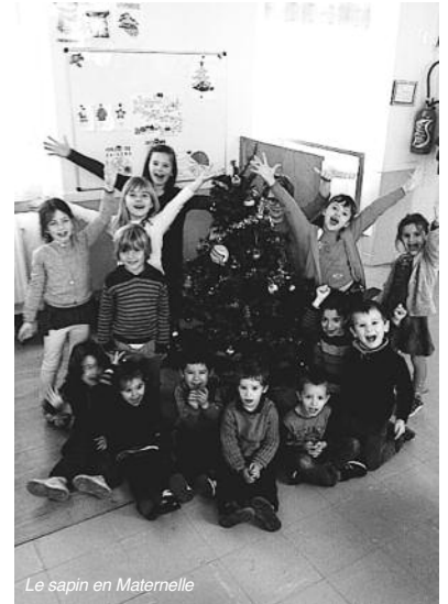
Le sapin en Maternelle

Tous avaient également préparé, avec l'abbé Etchenique, une célébration qui s'est déroulée le Jeudi 17 décembre, en présence de nombreux parents et grandparents. Un moment fort dans la vie de l'école !