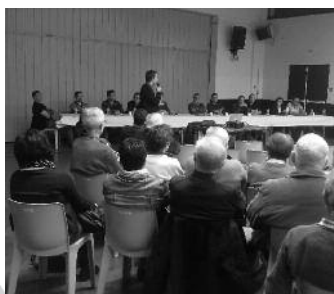
La réunion publique