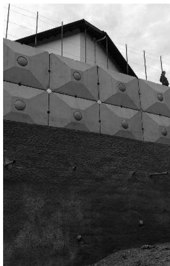
Les travaux de la falaise