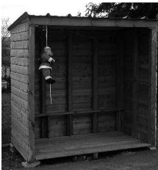
De nouveaux abris bus