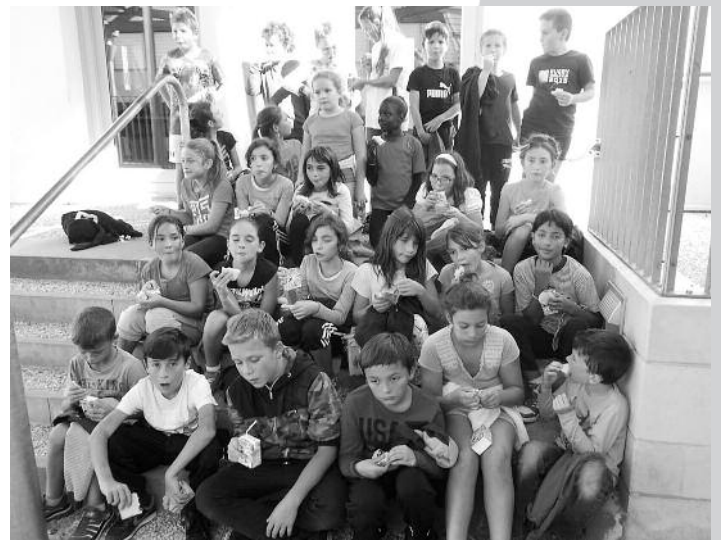
Après l'effort, le réconfort